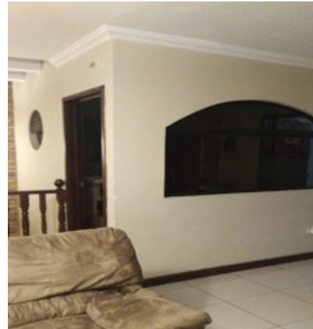
Residenciales El Valle