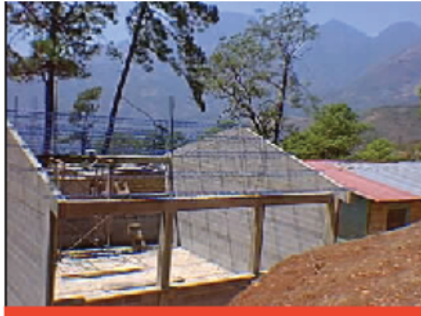
Edificios Escolares Para La Asociación Española Intervida.